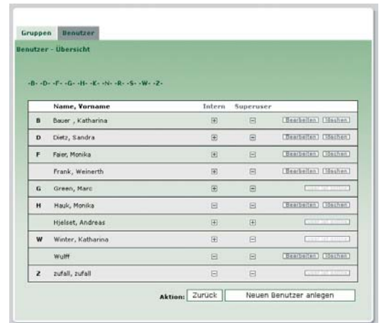
Die Benutzerverwaltung unter Einstellungen